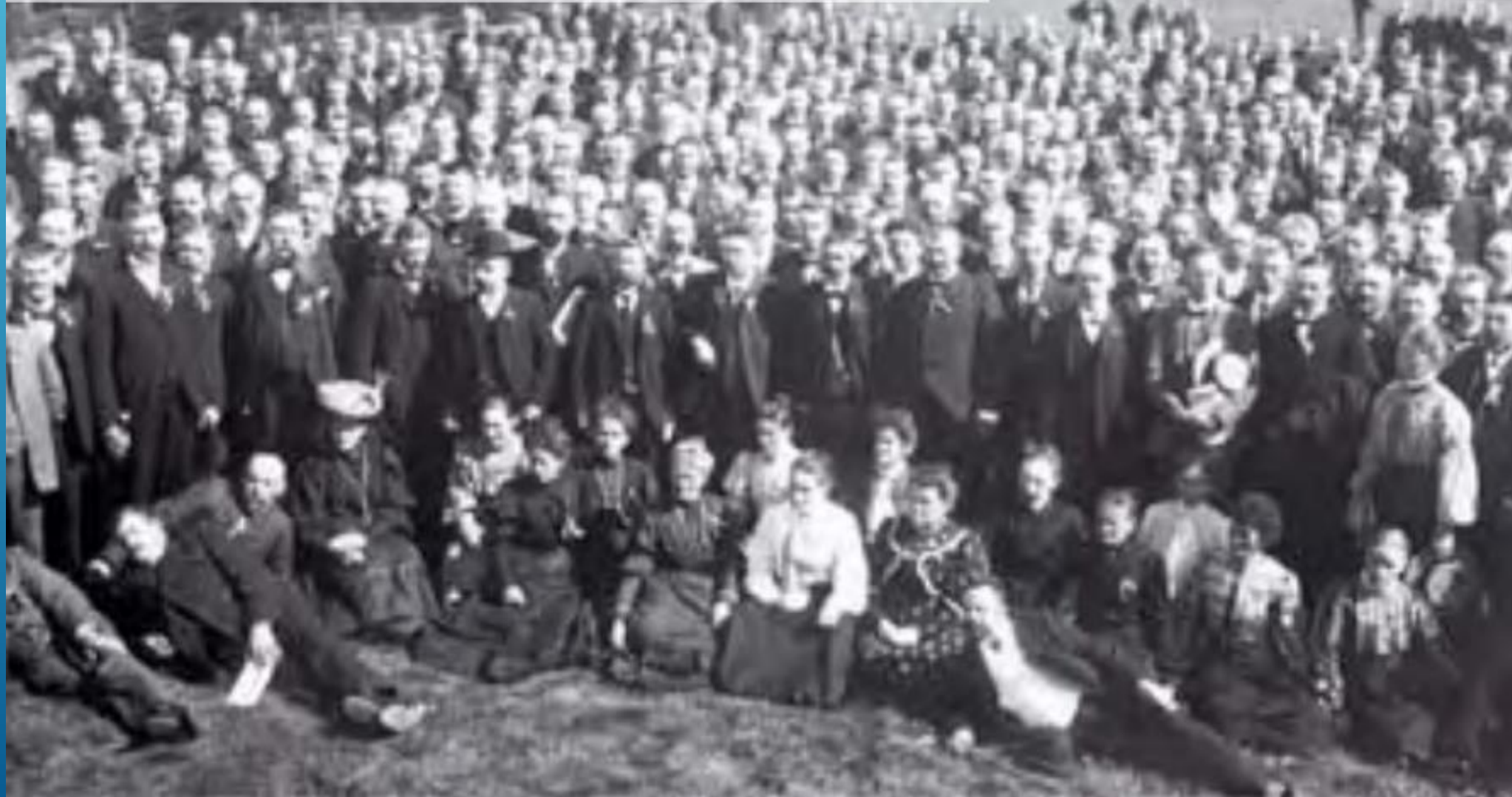
Svenska Sjukkasserörelsens första konferens 1905 i Norrköping