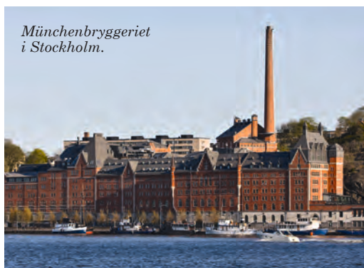
Münchenbryggeriet i Stockholm.