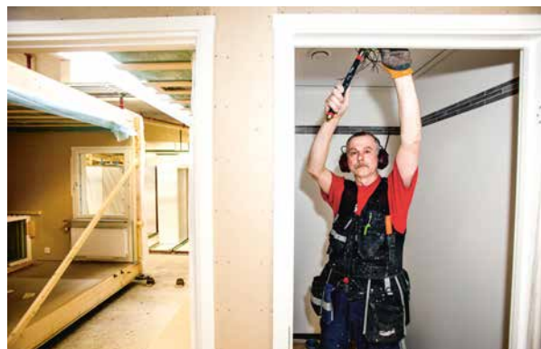
Genom kunskap som sprids i hela företaget ska riskerna minska.