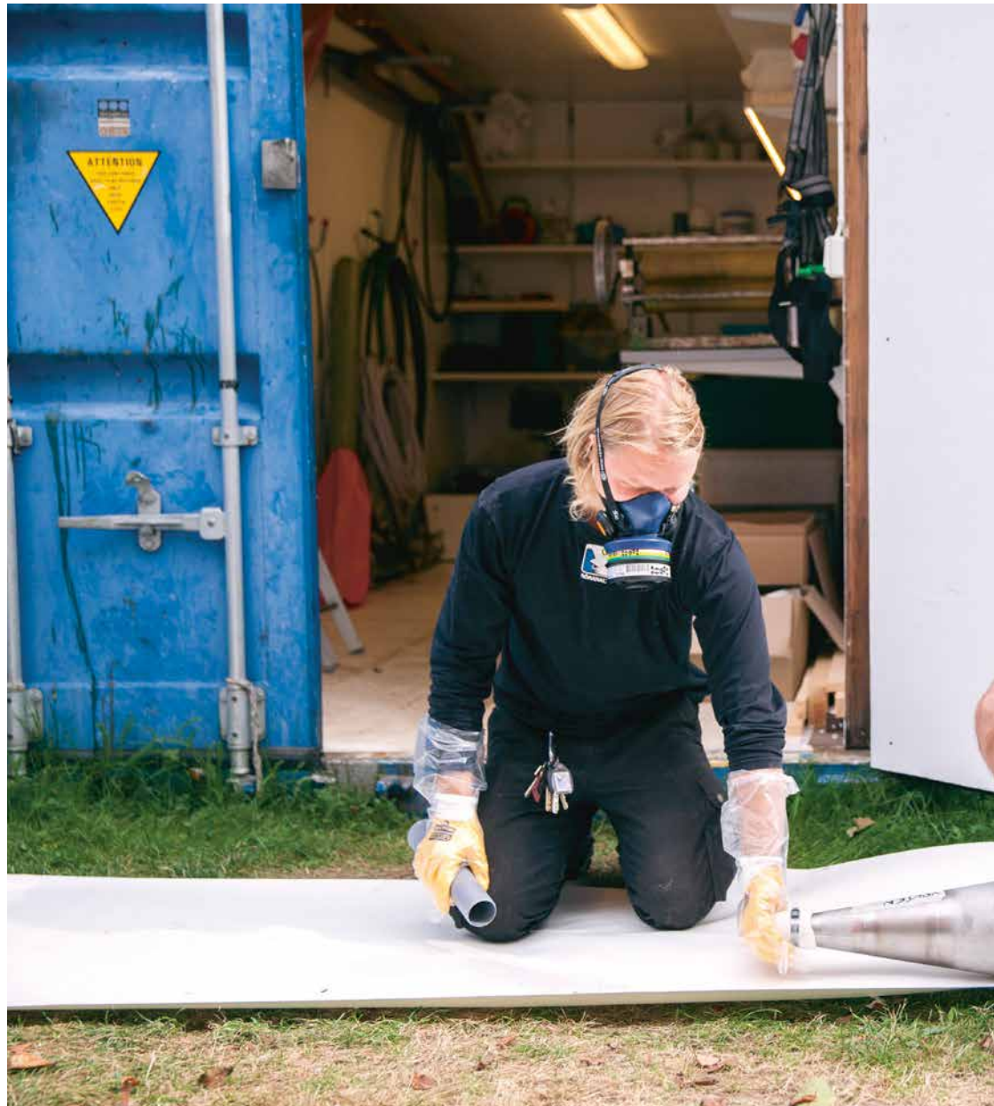
Arbetskadeförsäkringen ger 4,5 miljoner svenskar större trygghet på och på väg till och från jobbet. Varje år får cirka 55 000 personer ersättning efter arbetsskada eller arbetssjukdom.

5 Ersättning för arbetsskada kan betalas ut för inkomstförlust, kostnader i samband med arbetsskadan, sveda och värk, medicinsk invaliditet och skador som påverkar utseendet.