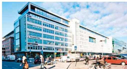
Klarabergshuset har fått solpaneler.

Nu kan ännu fler på den svenska arbetsmarknaden ta del av vad AFA Försäkring erbjuder. För att underlätta för arbetsplatser där det talas andra språk än svenska har AFA Försäkring tagit fram ett informationsmaterial på nio olika språk. Läs mer på afaforsakring.se/andra-sprak .