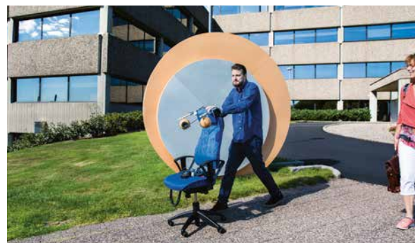
Nu ska forskarna utveckla en bättre prototyp av stolen för att den ska kunna tas i produktion.

– Vi vill jobba vidare med det här, för det är väldigt spännande att få människor att upptäcka att ljud inte bara är något man kan ta bort utan även lägga till för att få en bättre arbetsmiljö. ●