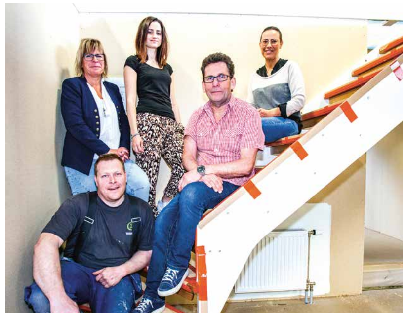
Skyddskommittén på Älvsbyhus har tillsammans tagit ett nytt grepp kring arbetsmiljön på fabriken.

verkas här i Älvsbyn där företaget har sin bas men också i värmländska Vålberg, skånska Bjärnum och i Kauhajoki i Finland.