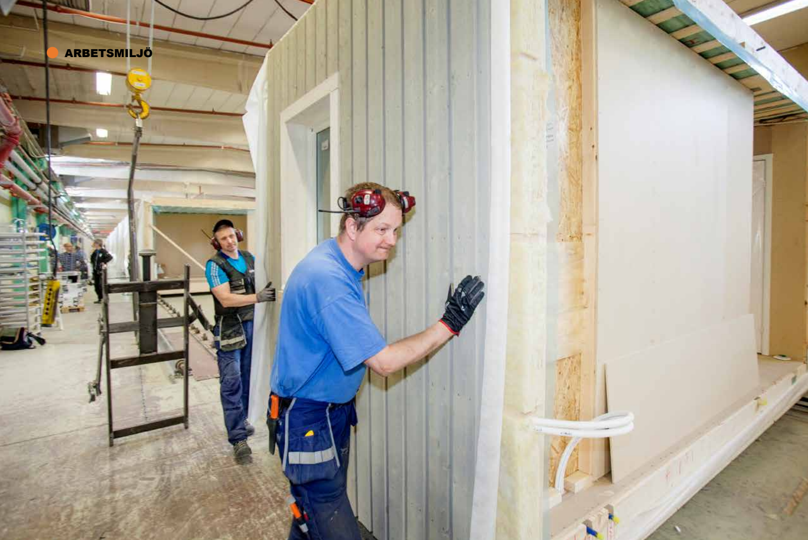
Den fysiska arbetsmiljön är på vissa sätt enklare att åtgärda i en fabrik. Den psykosociala biten kräver mer systematiskt arbete.