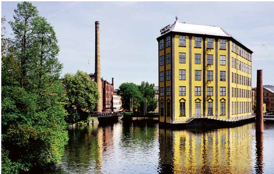
Arbetets museum ligger på Laxholmen mitt i Motala Ström som rinner genom Norrköping.