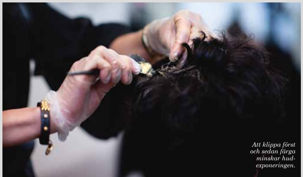
Att klippa först och sedan färga minskar hudexponeringen.

– Vi tycker att man ska använda munskydd när man blandar färg. Och handskar är givet när man färgar eller tonar hår, men även när man tvättar håret. Däremot är det nästan omöjligt att klippa med handskar, man får inte alls någon hårkänsla. De skulle i så fall behöva sitta så hårt på handen att det är olämpligt av andra skäl. ●