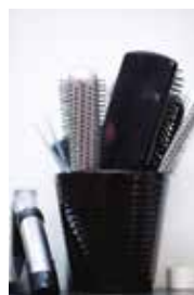
Kemikalierna fastnar även på utrustning.

En attitydförändring som ändå skett är att frisörerna generellt väljer att använda hårfärgningsmedel med lägre procent väteperoxid än tidigare.