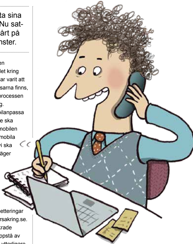
Inga fler frimärken. AFA Försäkring satsar hårt på att alla ärenden ska kunna skötas via dator och mobil.

Hur går arbetet till för att utveckla tjänsterna?