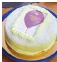
Inget kalas utan tårta!

att visa för kommuner och landsting vilka vinster det finns för dem med att växla om från att skicka in pappersblanketter till att anmäla digitalt till AFA Försäkring när medarbetare anmäler arbetsskada eller långvarig sjukdom.