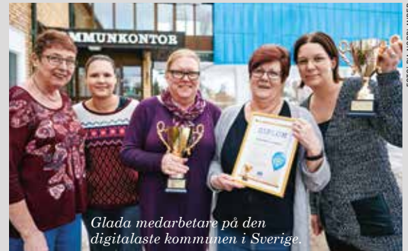
Glada medarbetare på den digitalaste kommunen i Sverige.

Bäst 2013. Bäst 2014. Nu siktar Surahammars kommun på att bli 100 procent digitala.