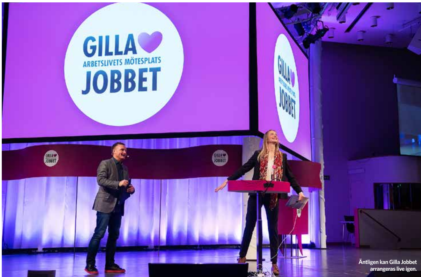
Äntligen kan Gilla Jobbet arrangeras live igen.