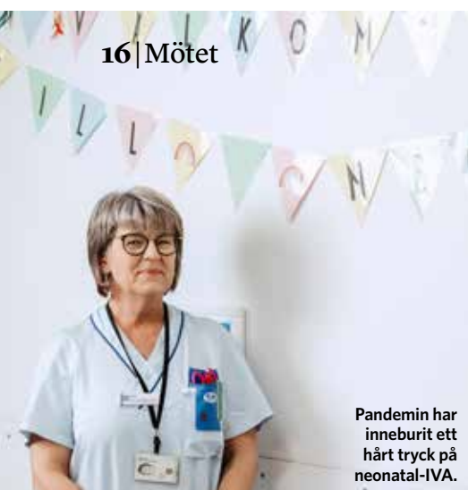
Pandemin har inneburit ett hårt tryck på neonatal-IVA.

kring eventuellt kvarstående problem. Den bedömningen har inte gjorts ännu.