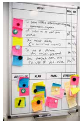
Bra planering är en bra start för en lugnare arbetsdag.