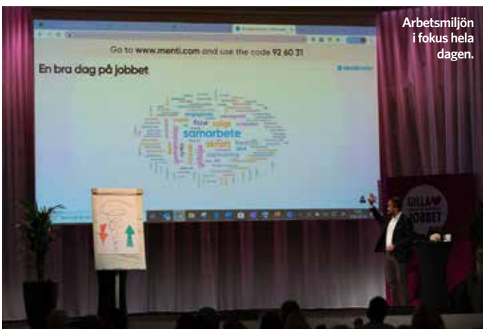
Arbetsmiljön i fokus hela dagen.

»Eftersom möten och dialog är en viktig ledstjärna för oss är det viktigt att låta människor kunna träffas på riktigt.«