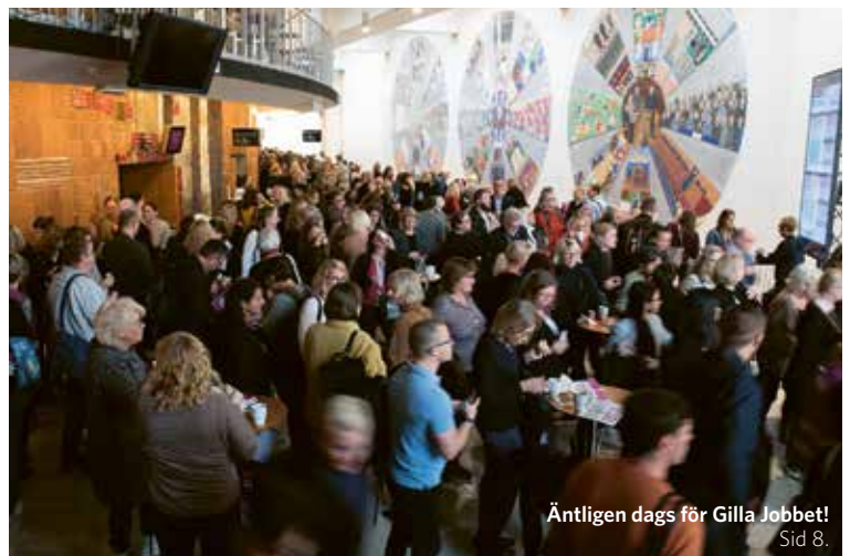
Äntligen dags för Gilla Jobbet! Sid 8.