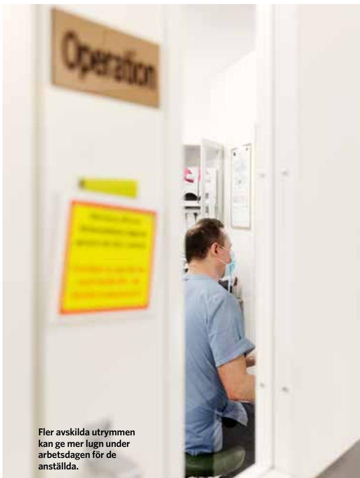
Fler avskilda utrymmen kan ge mer lugn under arbetsdagen för de anställda.