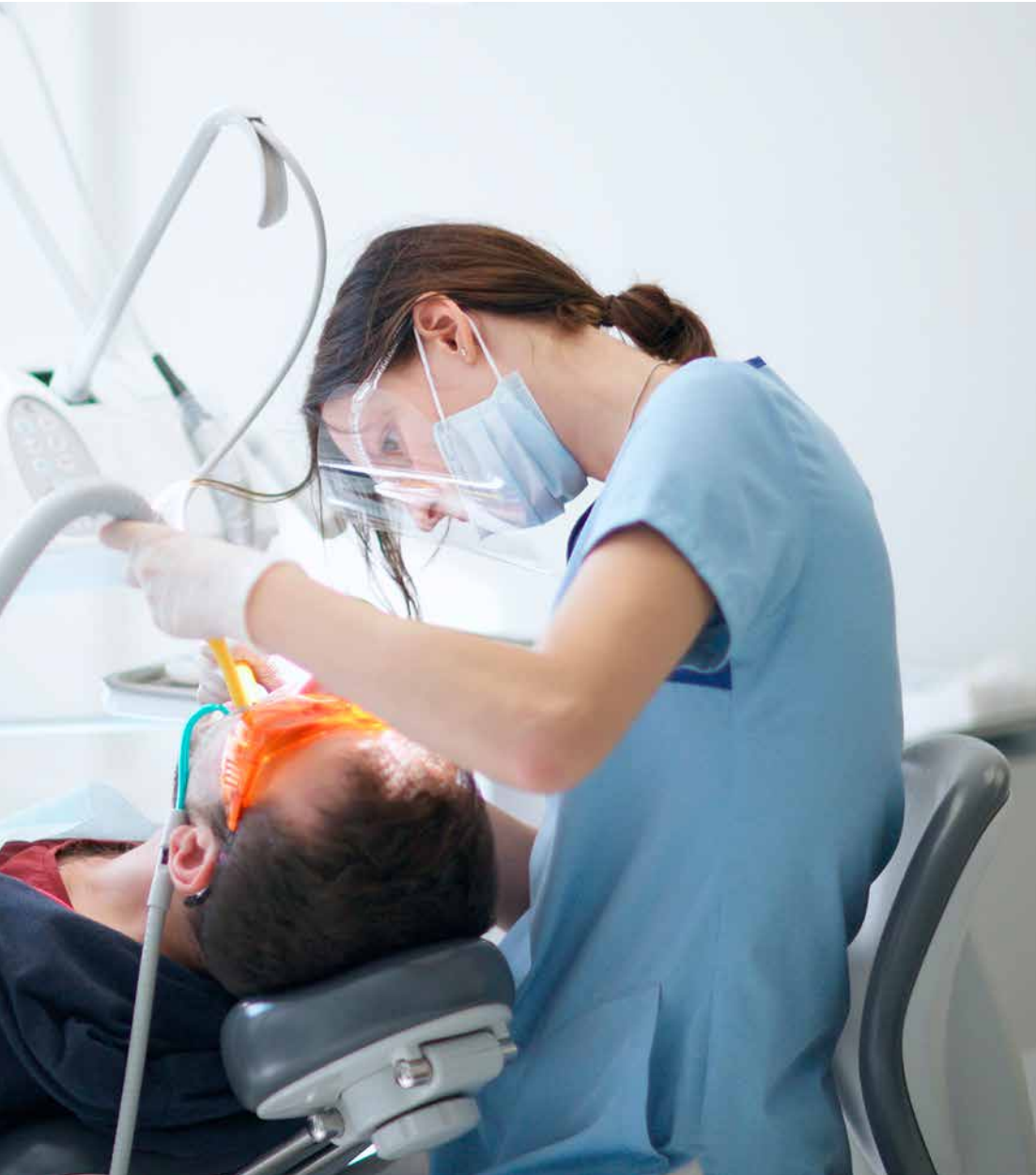
annat snickare, byggnadsarbetare och bilmekaniker. Men vibrationsskadorna kan förebyggas.