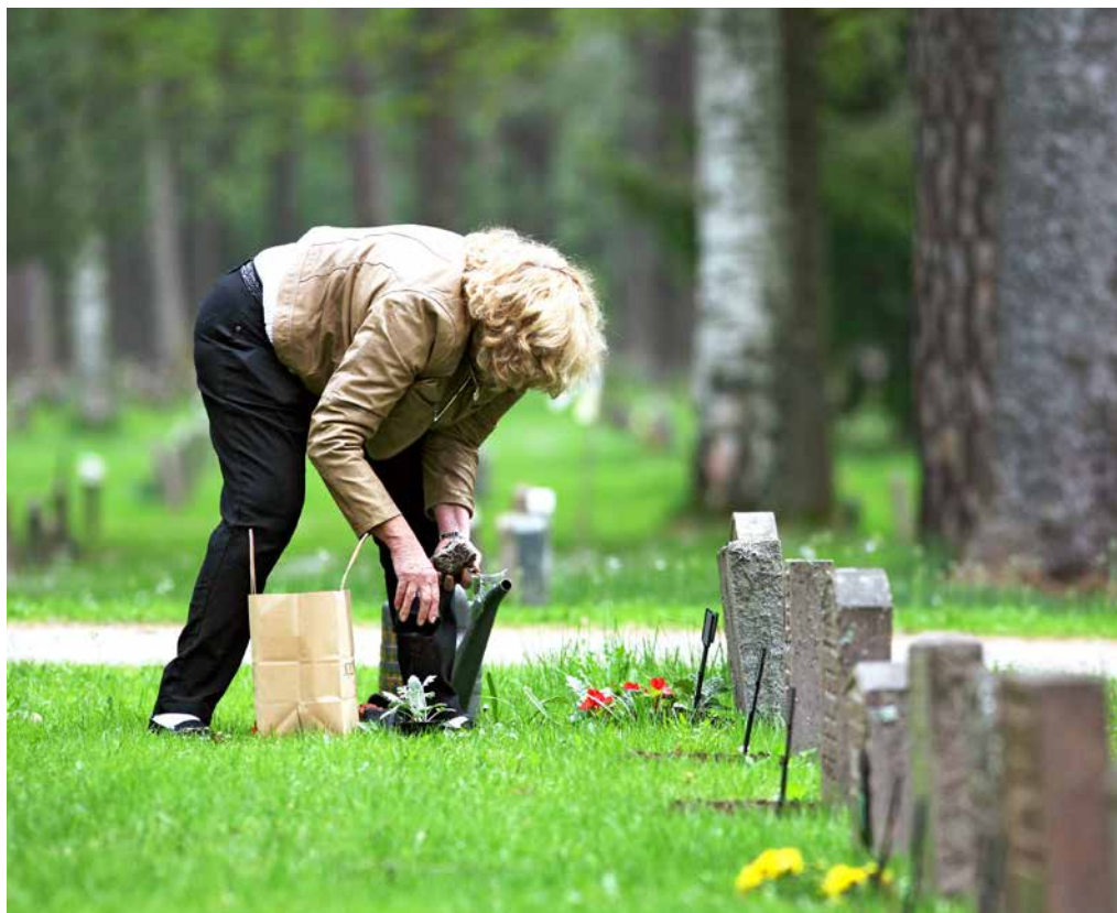
Ett nytt arbetssätt har gjort att AFA Försäkring når fler med rätt till ersättning från Tjänstegruppliv.