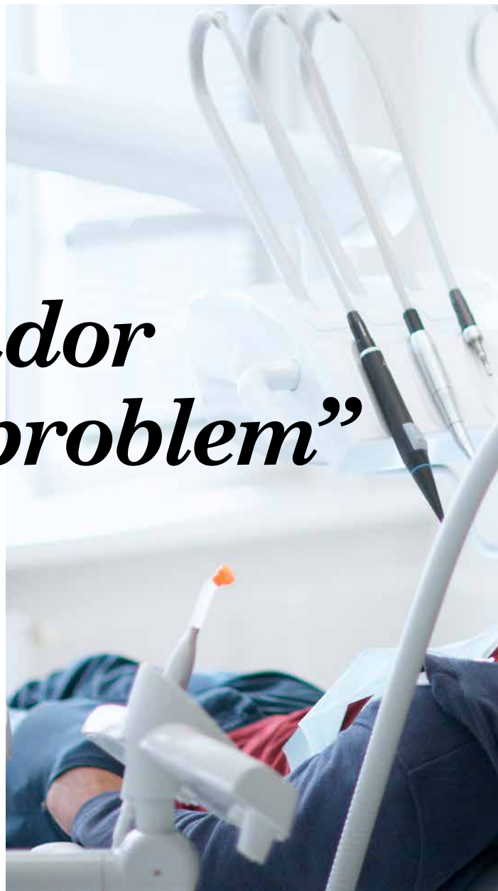
Tandvårdspersonal är utsatta för skadliga vibrationer, liksom bland

Det finns regler för hur länge man får använda vibrerande