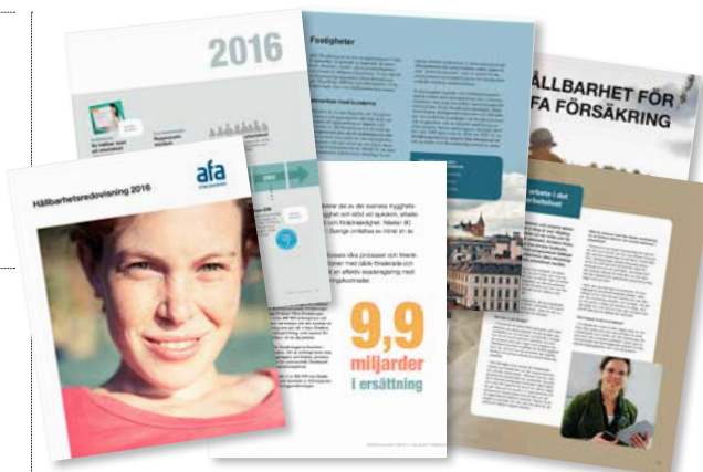
Hållbara försäkringar för ett hållbart arbetsliv.

Men hållbarhet är också att verksamheten utförs på ett ansvarsfullt sätt. En långsiktig och trygg kapitalförvaltning säkerställer framtida utbetalningar. Det ger också möjlighet till satsningar på förebyggande arbete som syftar till att förbättra arbetsmiljön och minska ohäl-