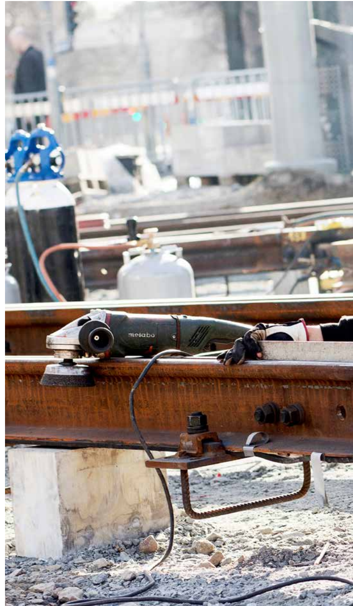
Hur arbetet planeras, vilken löneform de anställda har och attityden till

För en person över 60 år är sannolikheten att råka ut för en allvarlig arbetsplatsolycka drygt fyra gånger så stor jämfört med gruppen under 25 år, visar forsk-