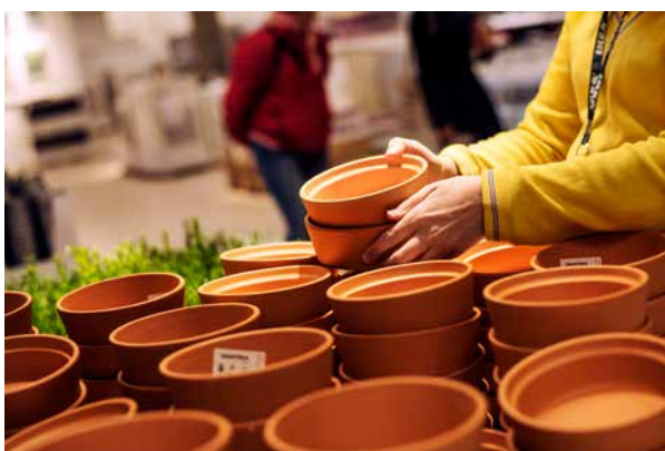
IKEA i Uppsala har flera pågående ärenden hos AFA Försäkring.

” Det finns en 'IKEA-anda' som genom-syrar hela huset.