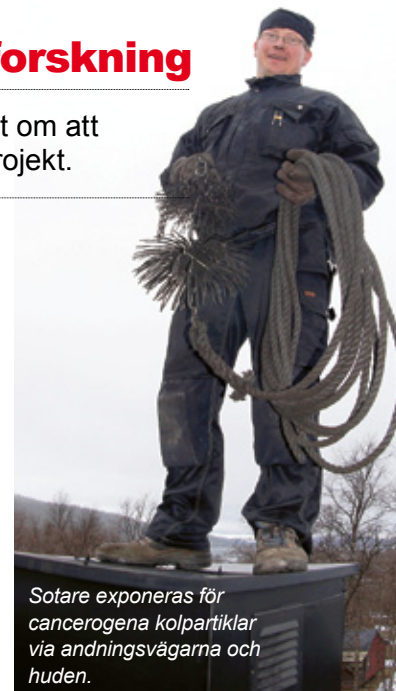
Sotare exponeras för cancerogena kolpartiklar via andningsvägarna och huden.