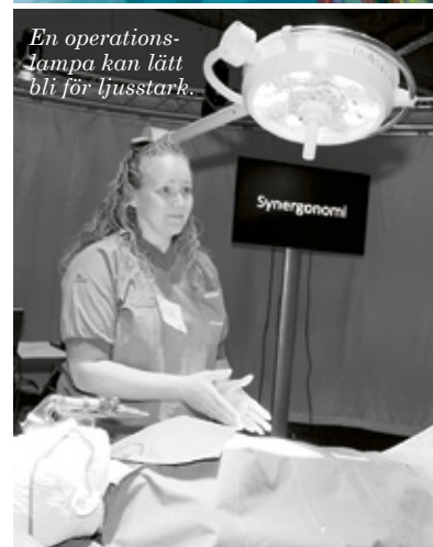
En operations-lampa kan lätt bli för ljusstark...